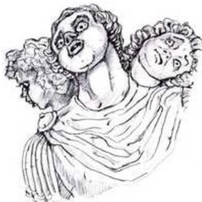
Logo del gigante de tres cabezas "Geriò", que según la mitología clásica es el fundador de Girona. Dibujo de Albert Bosch Vilalata

Universidad de Ciencias y Artes de Chiapas, Universidad de Guadalajara en México, Universidad de San Carlos de Guatemala, Universidad de Girona, Catalunya, España.